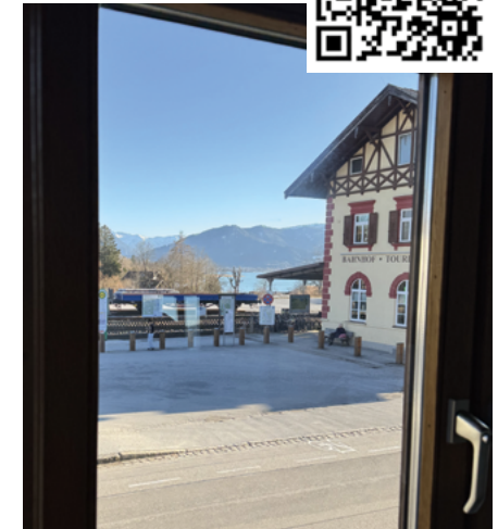
Traumblick durch die jetzt saubere Scheibe