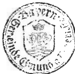
Georg von Preysing Erster Bürgermeister